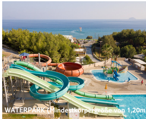
WATERPARK (Mindestkörpergröße von 1,20m)