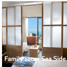
Family Room Sea Side