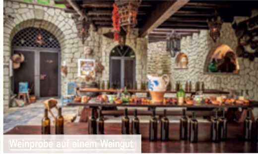
Weinprobe auf einem Weingut

auf alle im Hotel buchbaren Wellness-Anwendungen