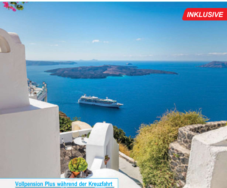
Vollpension Plus während der Kreuzfahrt