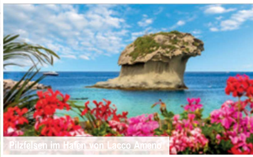
Pilzfelsen im Hafen von Lacco Ameno