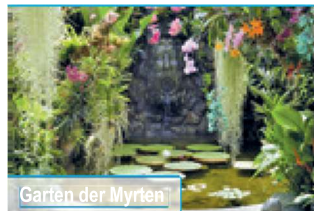
Gärten der Myrten