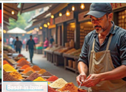
Basar in Izmir

Tag 10: Im bergigen, von dichten Pinienwäldern bewachsenen Hinterland liegt das von Aleviten bewohnte Dorf Demircidere . Die Aleviten sind eine liebevolle, synkretische Religionsgemeinschaft, die Sie gastfreundschaftlich empfängt. Freuen Sie sich auf einzigartige Trachten und genießen Sie Tee sowie selbstgebackenes Brot mit Käse und Oliven! Beim Besuch des Dorfmuseums staunen Sie über den ländlichen Brauchtum & Gebrauchsgegenstände.