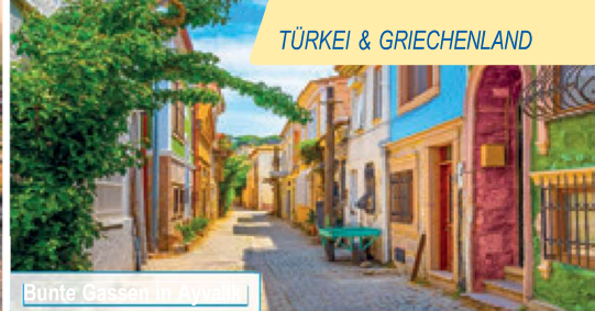
Bunte Gassen in Ayvalik