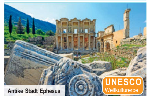
Antike Stadt Ephesus