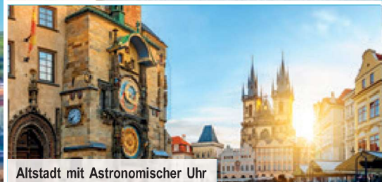
Altstadt mit Astronomischer Uhr