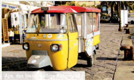
Ape, das bienenfließige Rollermobil