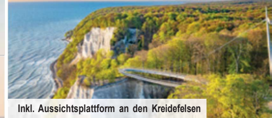
Inkl. Aussichtsplattform an den Kreidefelsen