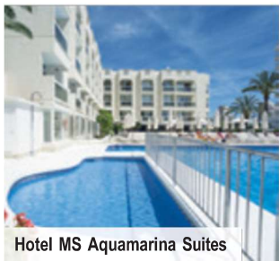
Hotel MS Aquamarina Suites

Tag 1: Ihre wundervolle Reise in Spaniens sonnigen Süden beginnt heute mit dem Flug von Deutschland nach Málaga und dem anschließenden Transfer zu Ihrem 4-Sterne-Hotel Moon Dreams Calabahia . Willkommen in Andalusien, willkommen in einer der schönsten Regionen Spaniens! Tag 2: Ganztägiger Ausflug nach Sevilla , in die malerische Hauptstadt Andalusiens und eine der schönsten Städte Spaniens.