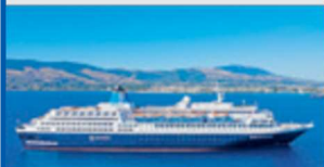
MS Blue Sapphire

Die MS Blue Sapphire bietet Ihnen sehr geräumige Kabinen mit höchstem Komfort. Die Vollpension Plus inkludiert neben den 3 Hauptmahlzeiten alkoholfreie & ausgewählte alkoholische Getränke zu den Mahlzeiten sowie Teezeit & Nachtsuppe.