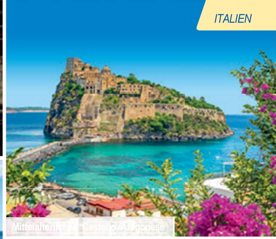
Mittelalterliche - Castello Aragonese