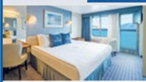
Beispielkabine Superior m. Balkon

oder erleben auf Wunsch eine Woche 5-Sterne-Strandurlaub mit All Inclusive an der türkischen Riviera.