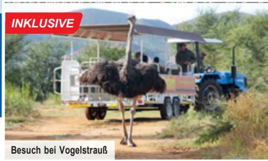
Besuch bei Vogelstrauß