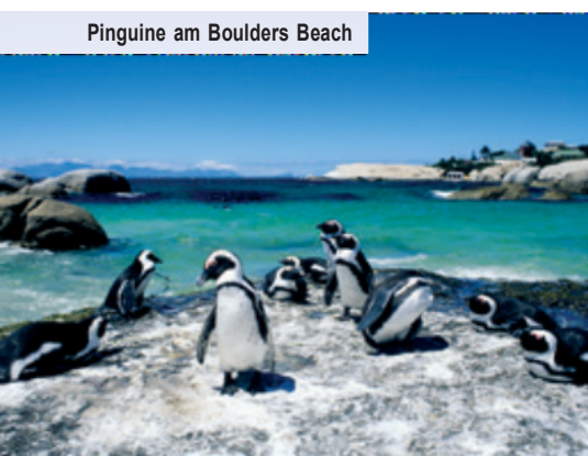
Pinguine am Boulders Beach

Hinweis: An manchen Terminen sind die Gruppenkontingente auf der Fähre stark limitiert. In einem solchen Fall bieten wir Ihnen alternativ einen Ausflug in den Botanischen Garten Kirstenbosch an. Es informiert Sie die örtliche Reiseleitung, falls es zu einer Programmänderung kommt.