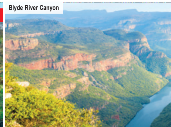
Blyde River Canyon