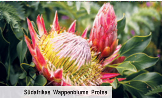
Südafrikas Wappenblume Protea