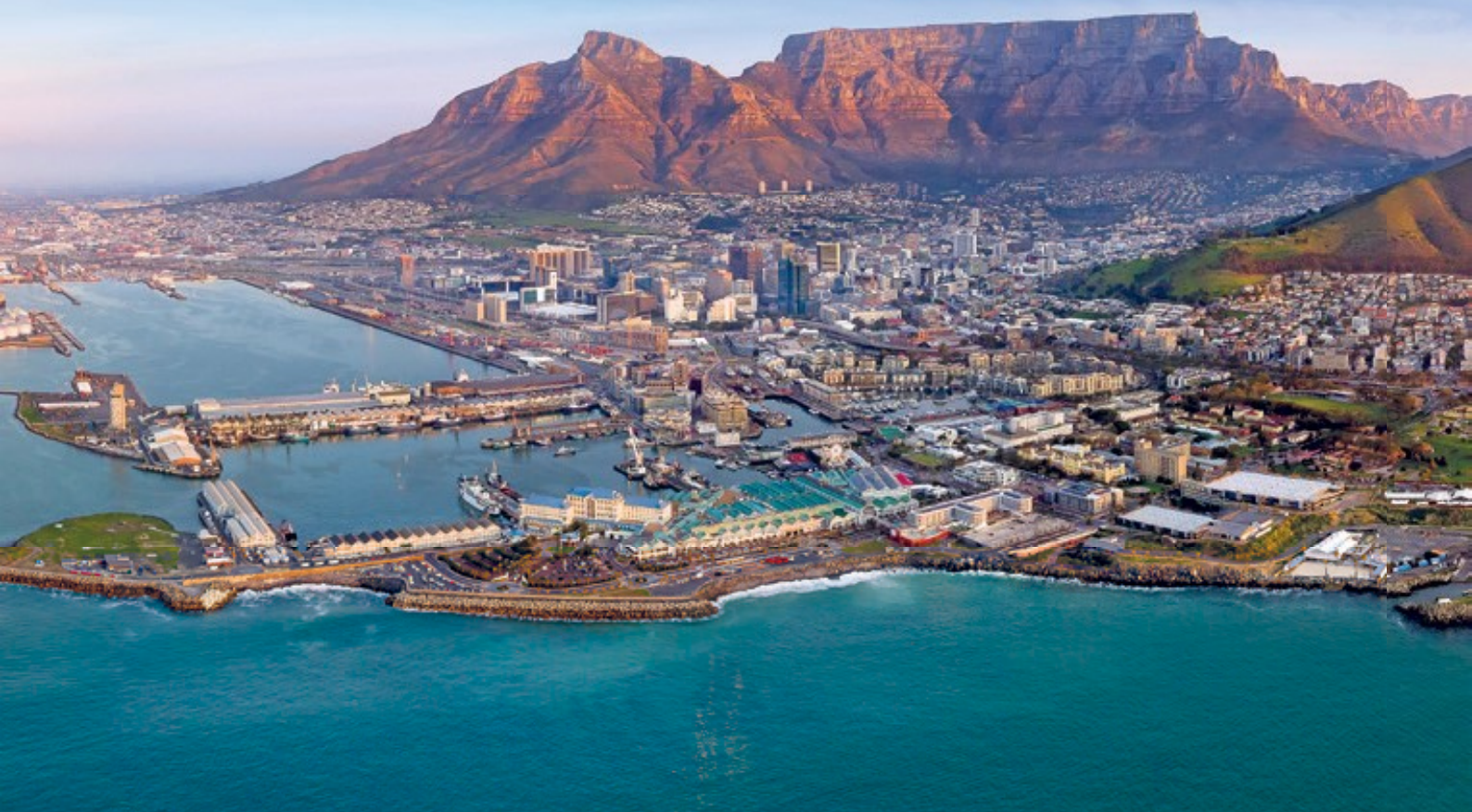
Blick auf Kapstadt

Große Erlebnis-Halbpension mit 14-Gänge-Menü im Gold Restaurant in Kapstadt inkl. Trommel-Workshop & typischem Boma-Barbecue mit Tanzdarbietungen unter freiem Himmel