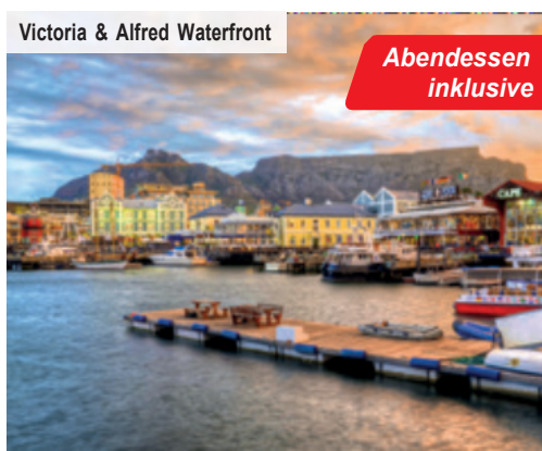
Victoria & Alfred Waterfront