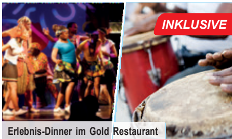
Erlebnis-Dinner im Gold Restaurant