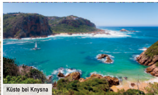
Küste bei Knysna