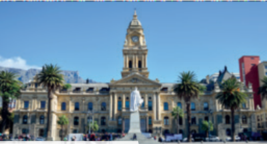
Rathaus von Kapstadt