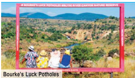
Bourke's Luck Potholes