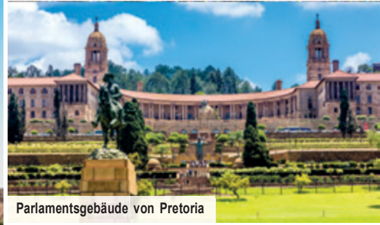
Parlamentsgebäude von Pretoria

Kruger-Nationalpark im offenen Geländewagen Fahrt entlang der Garden Route Besuch des „Big Tree Walk“ am Tsitsikamma-Nationalpark Panorama Route mit allen Eintritten