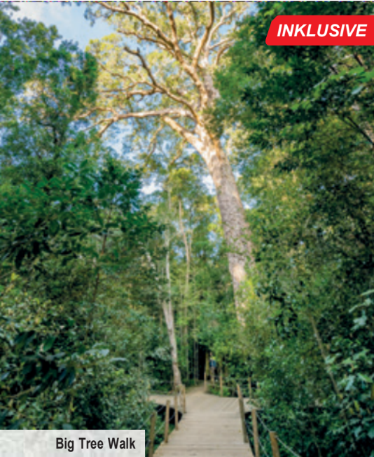
Big Tree Walk