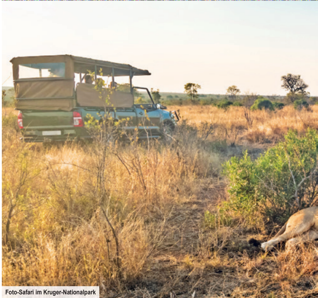
Foto-Safari im Kruger-Nationalpark