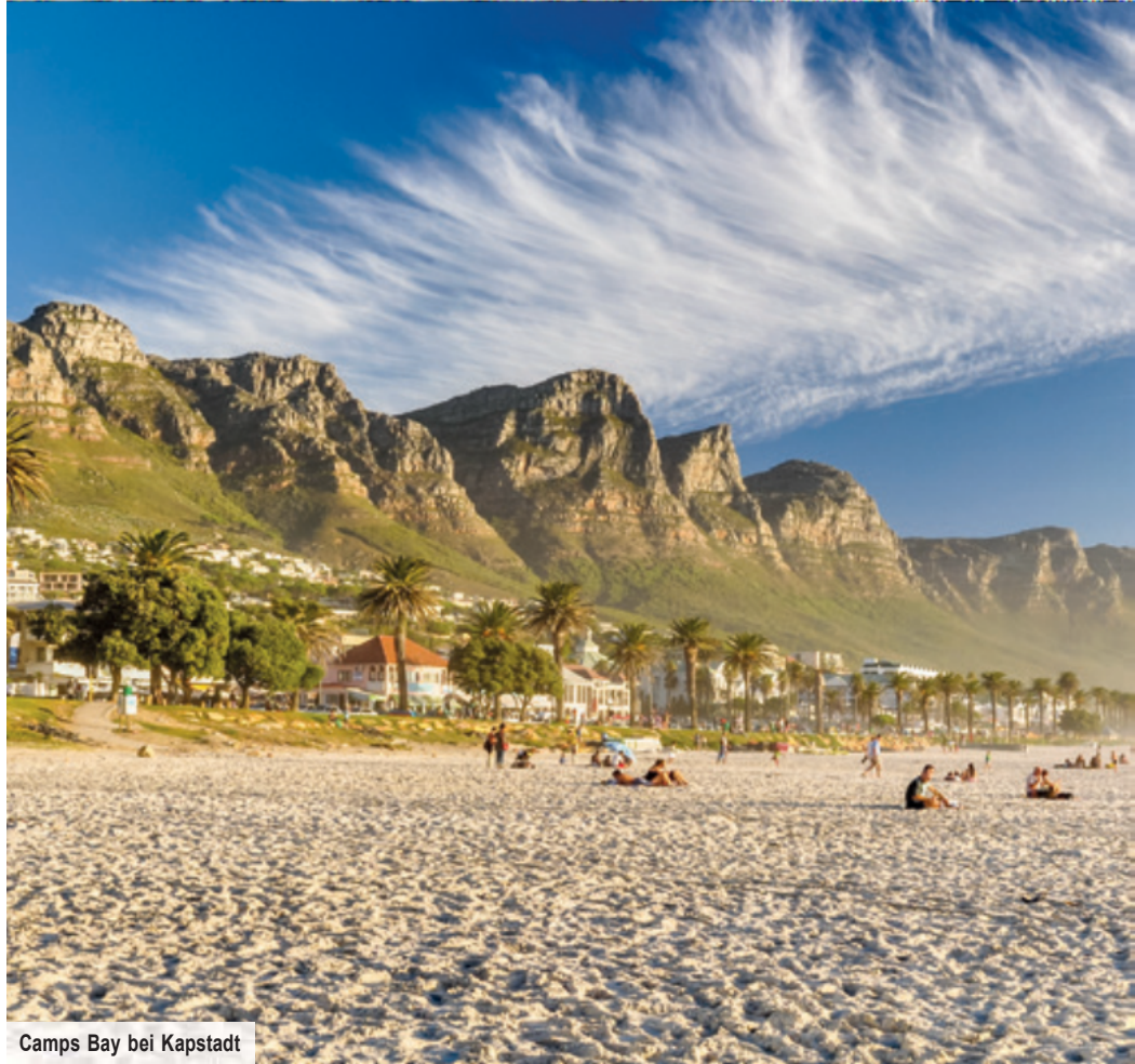
Camps Bay bei Kapstadt