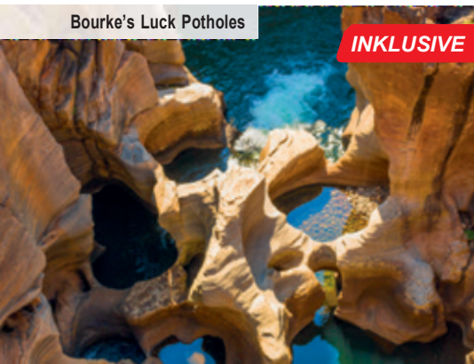
Bourke's Luck Potholes

Anschließend besuchen Sie das Hector-Pieterse-Museum, das Ihnen den Soweto-Aufstand gegen das Apartheid-Regime bewegend näherbringt, bevor Sie am Nachmittag nach Pretoria weiterfahren. Tausende von Jacaranda-Trompetenbäumen hüllen die Alleen und Plätze Pretorias zur Blütezeit in eine purpurne Blütenwolke. Ihre Rundfahrt führt Sie zum Sitz der südafrikanischen Regierung, in dem auch die Amtseinführung von Nelson Mandela stattfand.