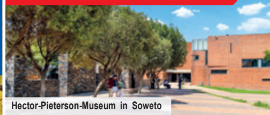
Hector-Pieterse-Museum in Soweto