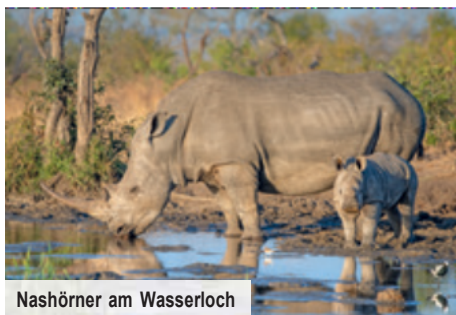
Nashörner am Wasserloch

Fremd, exotisch, atemberaubend schön: Der Norden von Südafrika ist faszinierend urwüchsiges Land. Auf der Panorama Route bieten Aussichtspunkte wie God's Window und Three Rondavels unvergessliche Ausblicke auf Berge, Täler, Wasserfälle und mächtige Schluchten, die das Wasser über Jahrtausende geschaffen hat. Interessante Fotomotive bilden auch die Bourke's Luck Potholes, gigantische Auswaschungen im Flussbett. Der Blyde River Canyon, drittgrößter Canyon der Welt, raubt mit seiner spektakulären Szenerie jedem Besucher den Atem! 800 Meter tief unter Ihnen schlängelt sich der Fluss durch eine malerische Bergwelt.